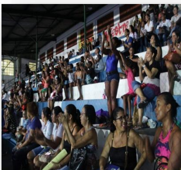
"Publikum, das während der Präsentation auf dem Schulhof anwesend war".

In einer verzauberten Nacht (26. März) gewann die Tanz-Gruppe in einer weiteren schönen Präsentation an Bedeutung. Die Zuschauer waren begeistert von dem, was sie gesehen hatten, applaudierten und gratulierten den Jugendlichen zu ihren Stimmen und der überbrachten Botschaft. Die Präsentation fand in einer von Espaço Cultural Alagado organisierten Aktion in der staatlichen Hochschule Präsident Costa e Silva statt.